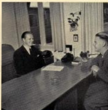
Norin handlägger huvudsakligen tjänstestyrningsfrågor.

Då de lönediskussioner, som numera försiggå mellan företaget och de anställdas organisationer, fordra en hel del statistiska uppgifter och sammanställningar, har personalavdelningen till uppgift att färdigställa dessa.