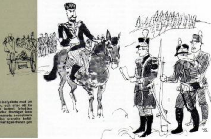
Sedan den svenska truppen ritstuckats med ett rida löp över Skellefteå, och efter att ha återtagit ett tidigare förlorat batteri, inledde reträtten från Skellefteå. Under återgången kom ryska parlamentärer och uppmanade svenskarna att kapitulera. Inne härpå den svenska befälhavaren sett den stora ryska överlägsnaheten gav han vika inför kravet.