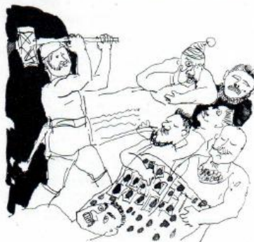
Albrecht i Myckle gick ensam in i grottan. Klubban föll sex gånger och sex av rövarens dog.

Så avlöpte det försöket. Men Albrecht i Myckle var inte nöjd med resultatet. Han träffade Märten Stål på julaftonen 1523 och föreslog då att