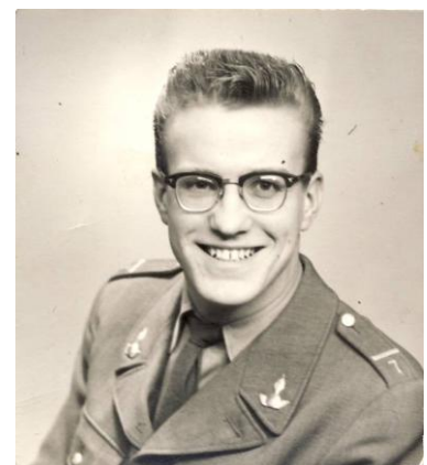
Lumpen vid Lv7 i Luleå 1957

Är numera lyckligt omgift sedan några år.