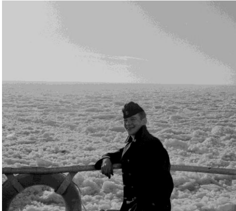
Ove på Ymer