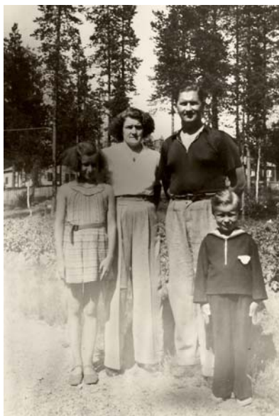
Familjen på kopparvägen 1943

Jag föddes i Forsnäs, Sorsele 1934. Omkring 1937 flyttade vi till Holmsjö, Malå där pappa och mamma hade köpt en jordbruksfastighet.